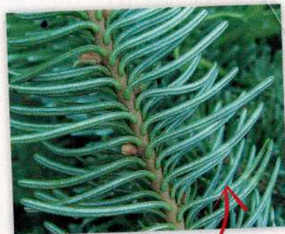
Skuļu apakšas ar baltajām atvārsnišu joslām.

Lielākoties dabā sastopama Kaukāza kalnos, kur tā aug kā lieli, majestātiski, vareni koki līdz 30 m augstumam. Latvijā pazīstama kopš 1967. gada, bet nav plaši izplatīta, jo juvenilā vecumā jutīga pret lielu aukstumu, pavasara salnām un meža zvēriem . Taču – ļoti, ļoti skaista. Izcili spožām, tumši zaļām garām skuļām, ar biezu vainagu,