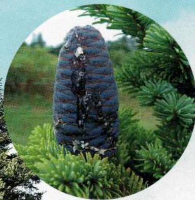
Korejas baltegle un tās čiekurs.