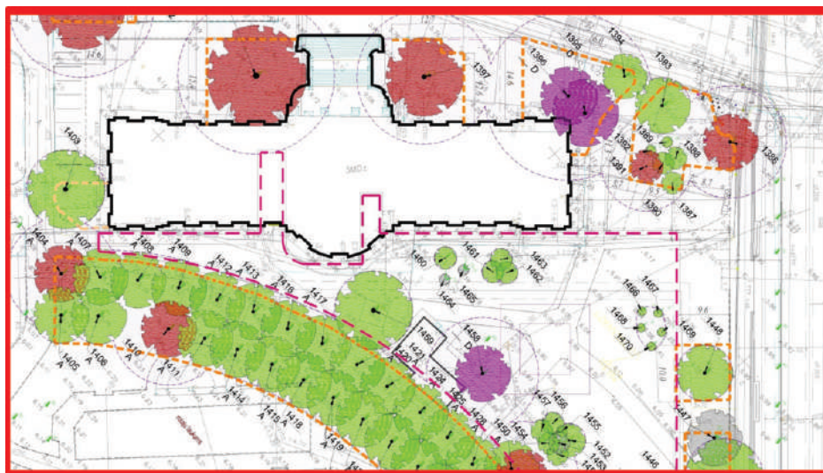
Koku vainagu projekcijas atzīmētas inventarizācijas plānā.

Koku novērtējums tiek apkopots inventarizācijas tabulās, savukārt koku vainagu projekcijas un koka vērtība (nevērtīgs, mazvērtīgs, vērtīgs, ļoti vērtīgs vai izcils) – attēlota topogrāfiskajā plānā. Šāds plāns atvieglo darbu ainavu arhitektiem un projektētājiem, kā arī ļauj precīzi saplānot teritorijas labiekārtojumu un ēkas, rēķinoties ar ārtelpas struktūras pamatveidotājiem – kokiem.